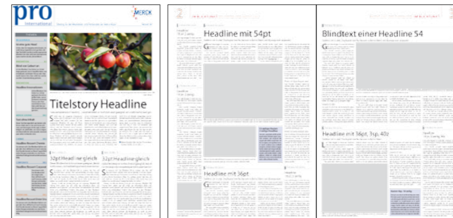
Muster-Template zu Mercks Mitarbeiterzeitung Pro . Die Redakteure füllen ganz einfach die vorgegebenen Textboxen.